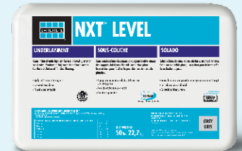
Data Sheet 504

NXT ® Level is a cement-based underlayment for use in leveling interior substrates. NXT Level produces a flat, smooth and hard surface for the installation of finished flooring. NXT Level can be placed from 1/8" to 3" (3 to 76 mm) in a single lift. Finished flooring can be installed in as little as 24 hours.